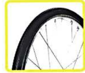
28×1 1.2 ATB10