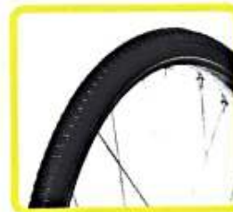
28×1 1.2 DC